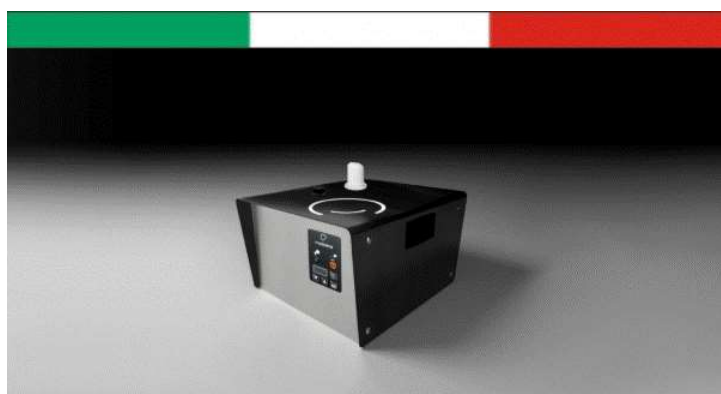
PURE est un matériel développé et fabriqué en Italie